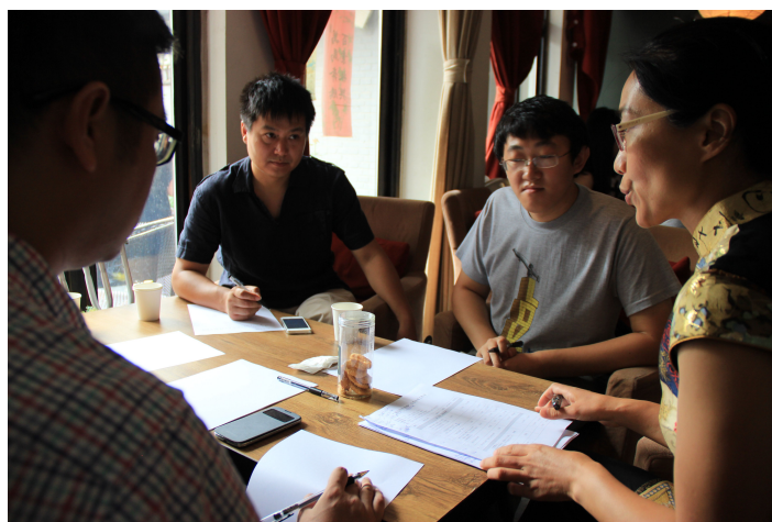
北京瓷娃娃给 2014 年实习生工作培训